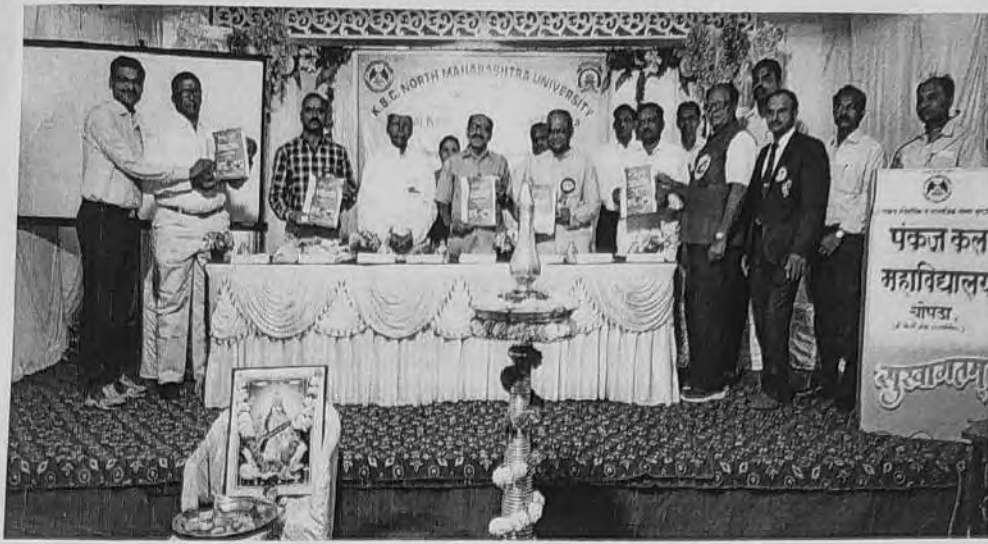
Publication of Souvineer