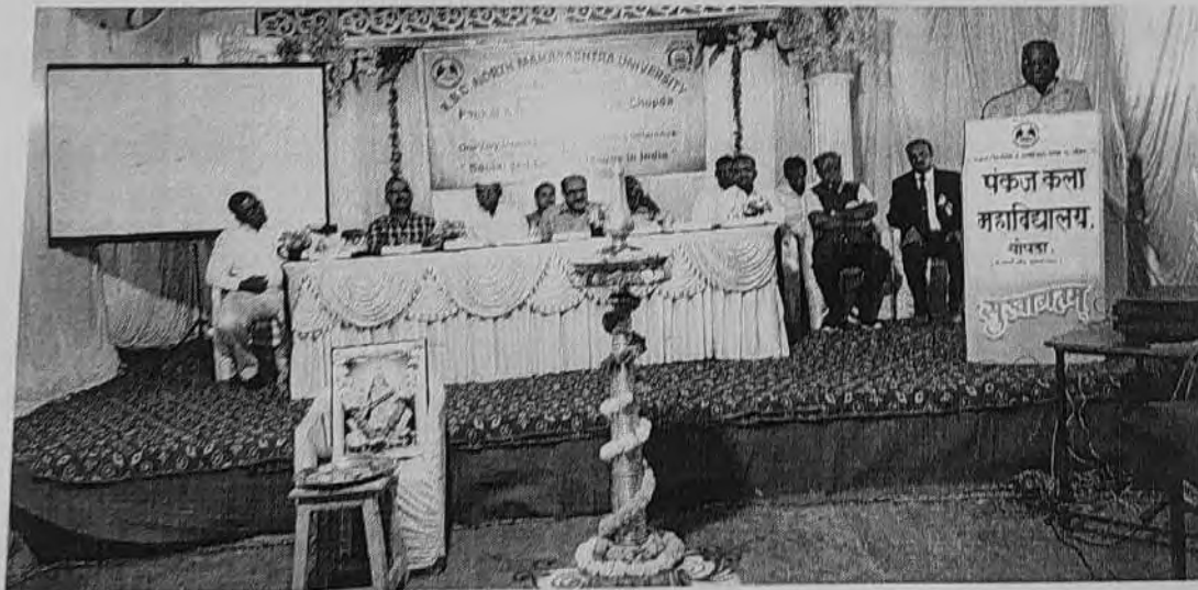
Inaugural Speech by Hon'ble Dilip R. Patil